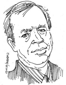
⑦ BERNARD MARIS DIT ONCLE BERNARD, ÉCONOMISTE ET CHRONIQUEUR.

Attac a été spécifiquement touchée par l'assassinat de Bernard Maris à Charlie-Hebdo. Elle doit beaucoup à la forte personnalité de « Oncle Bernard » qui a œuvré à la création d'Attac et à son Conseil Scientifique.